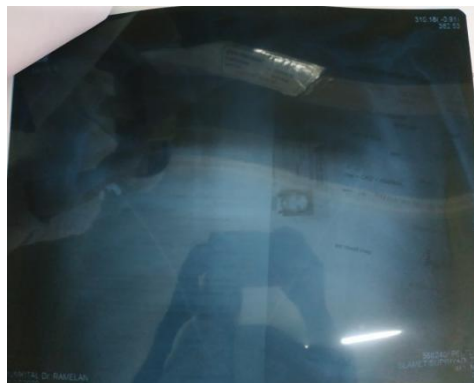
Gambar 3. 1Photo Thorax