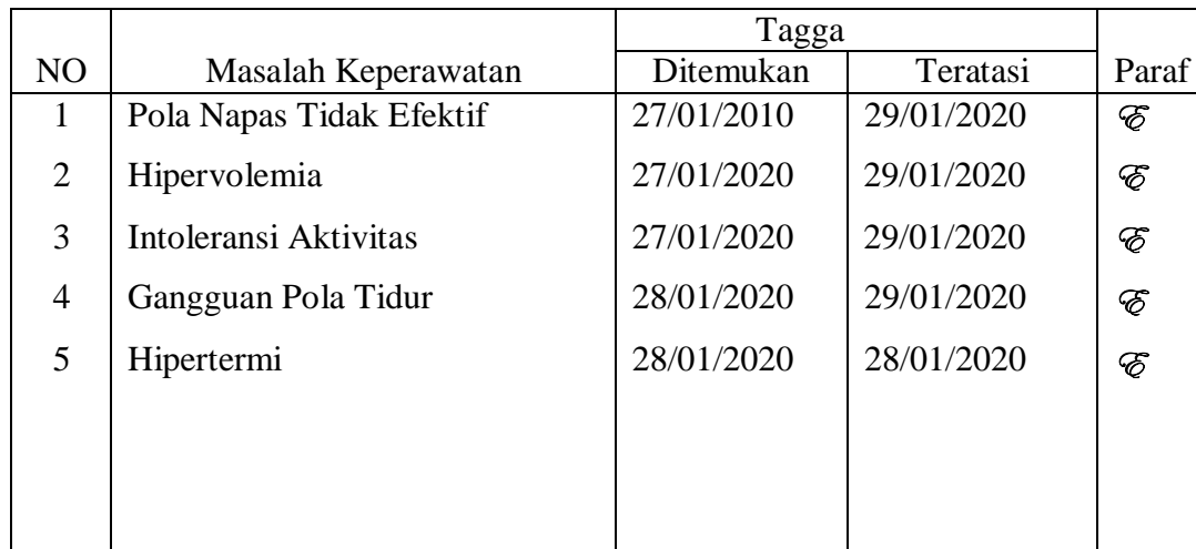
Tabel 3. 4Prioritas Masalah