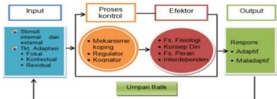
Gambar 2.1 Skema Teori Adaptasi Roy

Respon tersebut selain menjadi hasil dari proses adaptasi selanjutnya akan juga menjadi umpan balik terhadap stimuli adaptasi.