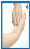
POSISI KUNCI TANGAN