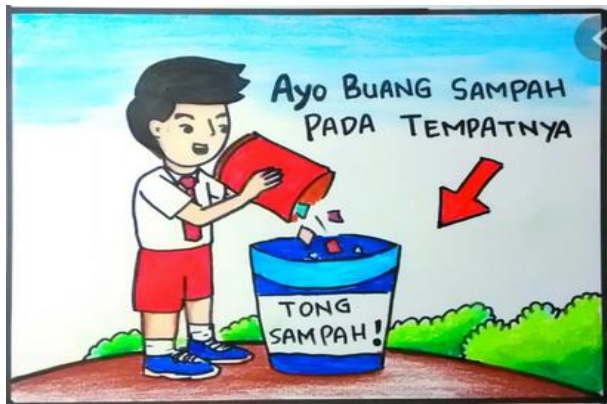
Sumber : (3)