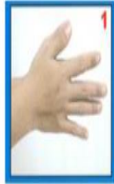
GOSOK KEDUA TELAPAK TANGAN